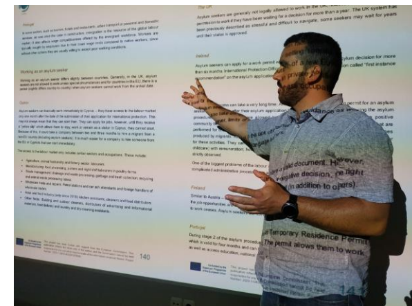
Evento Multiplicador em Portugal

This project has been funded with support from the European Commission. This publication reflects the views only of the author, and the Commission cannot be held responsible for any use which may be made of the information contained therein. Project Number: 2020-1-UK01-KA204-079165